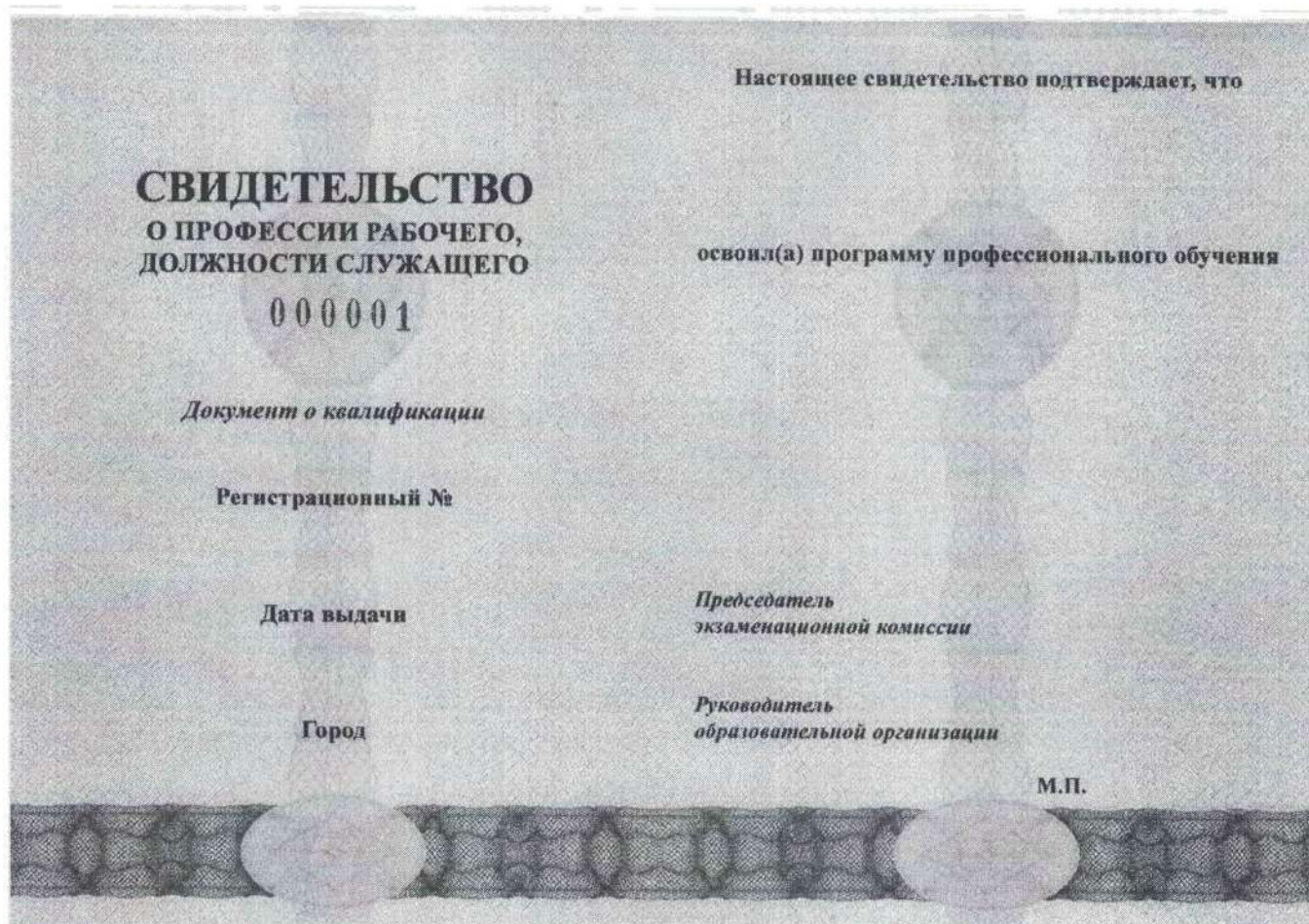
Рисунок 1. Обратная сторона бланка свидетельства о профессии рабочего, должности служащего